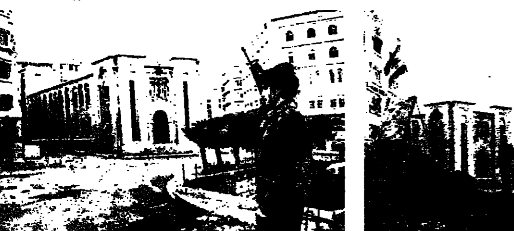
امام مبنى البرلمان في ساحة النجمة (محمود الطويل)

حدث اللجنة الامنية الساعة الرابعة بعد ظهر امس موعداً لانتشار الكتيبة ٦١ في ساحة النجمة ومحيط مبنى البرلمان القديم في الوسط التجاري، ونزع كل السواتر والنشم من المنطقة قبل ظهر اليوم الاثنين، على ان تقفل كل المكاتب الحزبية في المنطقة. وكان انتشار الكتيبة تأخر لبعض الوقت.